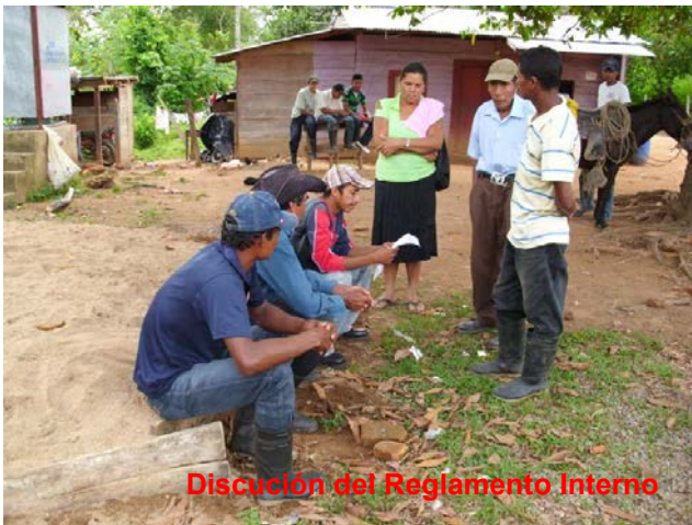
Discusión del Reglamento Interno

En las capacitaciones tuvimos una participación del 100% de los beneficiarios a igual que la participación de las mujeres. Durante el desarrollo del proyecto hubo algunos cambios de