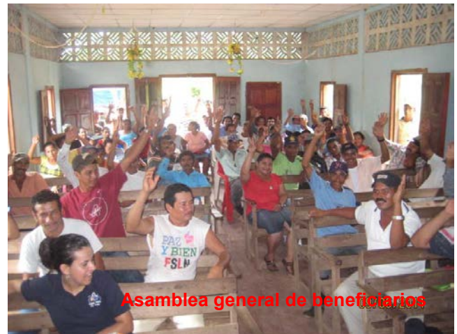
Asamblea general de beneficiarios

personas en el CAPS, de manera que al final los miembros del comité trabajaron de acuerdo al rol que tenían que cumplir.