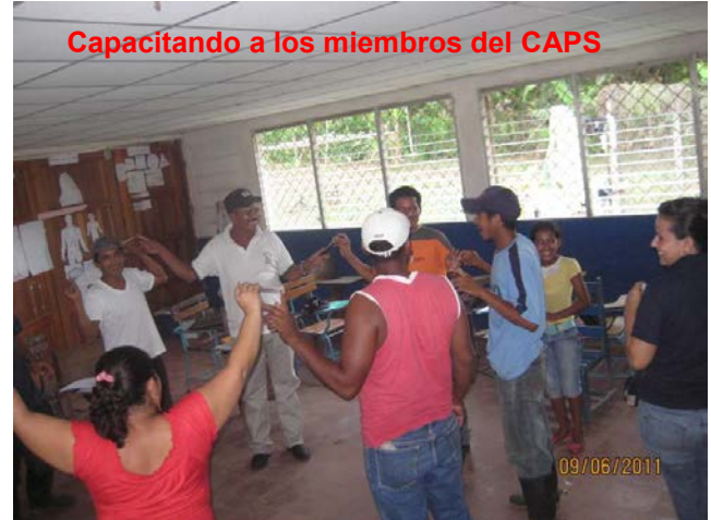
Capacitando a los miembros del CAPS

En las capacitaciones tuvimos una participación del 100% de los beneficiarios a igual que la participación de las mujeres. Durante el desarrollo del proyecto hubo algunos cambios de