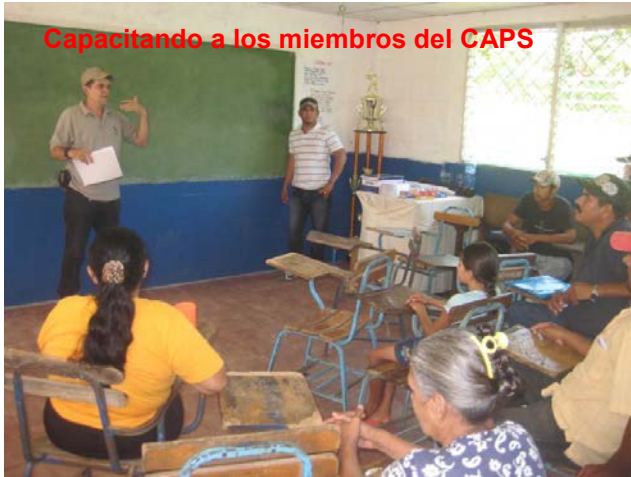
Capacitando a los miembros del CAPS