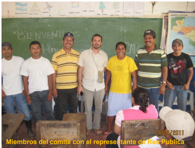
Miembros del comité con el representante de Res Publica

El comité trabajo mantuvo la organización para mantener el cumplimiento de los acuerdos entre comunidad y APLV, y realizar gestiones con las instituciones del municipio. De igual manera cuando realizamos visitas domiciliarias a las familias que se estaban desanimando, ellos fueron unos de los primeros en estar con el equipo de APLV, para acompañarlos y explicarles a las familias el por qué era importante trabajar en el momento de la ejecución física del proyecto.