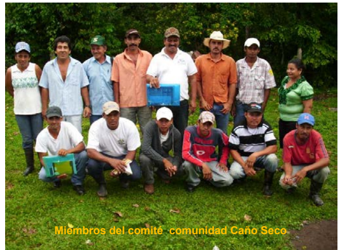
Miembros del comité comunidad Caño Seco

Finalmente se estructuró el comité de agua potable y saneamiento quedando los siguientes miembros.